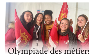
Olympiade des métiers